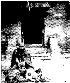
平型關戰後繳獲的日軍戰利品

到下午兩三點鐘，東西搬完了，槍聲也不響了。隊伍撤回到了山上，準備着日軍的增援部隊來到。上山不久，就聽說由于六八七團的堵截，日軍的增援部隊沒有能够過來。平型關戰鬥勝利結束。