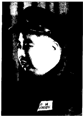
調任中國人民解放軍空軍副政委兼政治部主任和空軍副部長