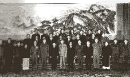
與軍委辦事處成員會見外賓（前排正中為吳法憲）