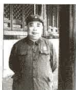
吳法憲在天安門城樓上