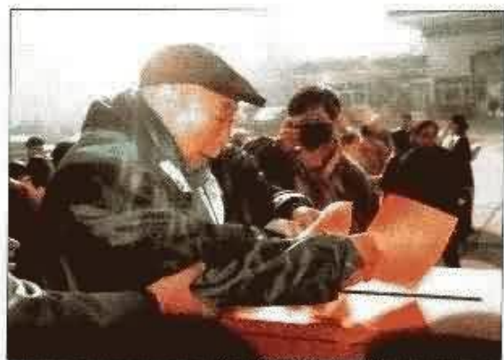
吴法宪任全国人大常委会第一次参加选举