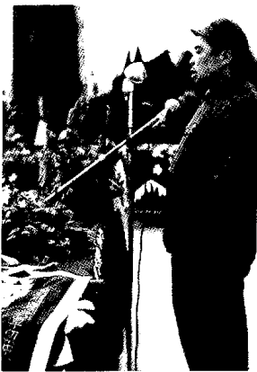
給部隊作報告。時任中國人民解放軍十三兵團副政委兼政治部主任。

去進行政治動員和政策教育。當時，歸十三兵團指揮的共有三十八軍、三十九軍、四十五軍和四十九軍。除三十九軍外，我對其它三個軍的情況都不了解。因此，我到任後，首先就是去部隊了解情況，幫助部隊實際準備進軍廣西的工作。