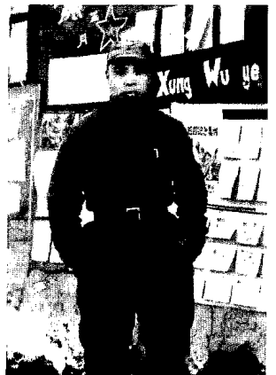
在蘇北滌海抗日根據地

一九三九年十二月至一九四〇年二月間，由當時的中共中央中原局書記劉少奇在華中主持召開了三次中原局會議。會議按照黨中央的戰略意圖，結合華中敵、友、我各方面的情況，深入研究了我們在華中的戰略發展方向。會議認為，蘇北地區已成爲敵後，國民黨祇有韓德勤部在那裏活動，而韓部內部矛盾重重，深爲人民所痛恨，因此我們如向東發展，開辟蘇北，不僅在政治上有利，在軍事上有利，而且蘇北地區靠近山東，還可與山東的