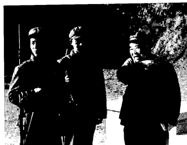
九屆二中全會在廬山看望警衛部隊

我這是第一次上廬山，來到山上一看，廬山上還真不愧是毛澤東所說的，“無限風光在險峰”，風景很好。山上的房子都是依山勢而建，因而不大集中。在水庫邊上，專門給毛澤東修