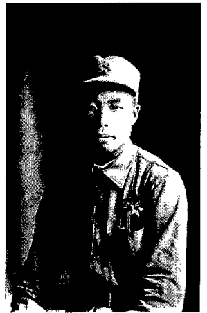
紅軍長征後在陝北根據地

吳起鎮是個小鎮子，地處黃土高原，石頭較少，鎮上大都是用土磚砌起來的房子。另外，還有一些窑洞，街上基本上沒有什麼人，也沒有賣東西的，但卻看到了牆上