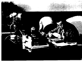
在面山軍委辦事組駐地

根據毛澤東和林彪的指示，我們軍委辦事組作了真的研究，決定將具體的組織實施工作，主要交由沈軍區、北京軍區和新疆軍區去執行。同時，要求解放三總部、海軍、空軍以及